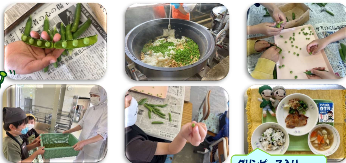
グリーンピース入り わかめごはん

4月21日に、2年生がグリーンピースのさやむき体験を行いました。この体験は、食に関する関心を高めることを目的として行っている活動です。みなさんが一生懸命にむいてくれたグリーンピースは、調理員さんが美味しく調理し、「グリーンピース入りわかめごはん」として給食時間に提供しました。新鮮なグリーンピースの甘みを味わうことができ、どのクラスもよく食べていました。